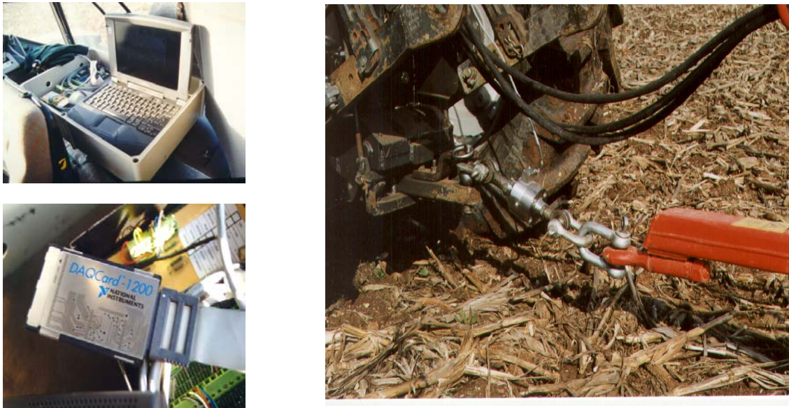
Figura 2 : À esquerda, em cima, condicionador de sinal e computador portátil; à esquerda, em baixo, placa de aquisição de dados; à direita, célula de carga instalada entre a "barra de puxo" do tractor e a lança da alfaia rebocada