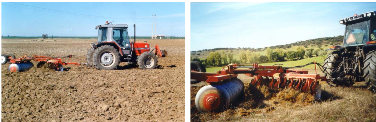
Figura 4 : À esquerda, conjunto tractor-grade de discos "offset"; à direita, pormenor da grade de discos "offset" em posição de trabalho

No procedimento de selecção da mudança mais alta permitida em cada situação de ensaio, impuseram-se 3 condições: -a combinação regime-mudança não devia conduzir a velocidades de trabalho excessivas tendo em conta a segurança e o conforto do operador; -a velocidade assim obtida não devia colocar em questão os objectivos técnicos e a qualidade do trabalho pretendido; -o par mudança-regime assim definido não devia conduzir a situações de sobrecarga do motor; sempre que se verificassem quebras do regime em carga superiores a 200 r.p.m. relativamente ao regime estabelecido em vazio, o operador seleccionava uma mudança imediatamente abaixo.