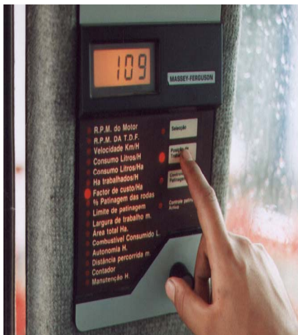
Figura 1 : Consola do sistema de informação "Datatronic" da Massey-Ferguson

No entanto, este sistema de informação comercial apresenta duas limitações para efeitos de desenvolvimento de trabalhos de investigação: por um lado, não permite o registo dos dados; por outro, não inclui a possibilidade de medição de um parâmetro fundamental na avaliação da dinâmica tractor-alfaia, a tracção na barra. Para contornar estas limitações foram efectuados dois desenvolvimentos: